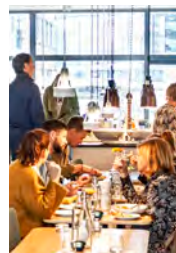
Lunch och fikastunder blir viktiga tillfällen att stämna av under.

Staffan Yngvesson om ett bra förhållningssätt för begravningsombud.